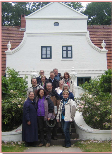
Ausflug nach Worpswede mit Besuchern aus unserer Partnergemeinde in Harwich zum Ausklang des Jubiläumshalbjahres