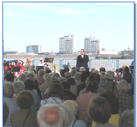
Regionales Gemeindefest auf der Weserfähre im Juli