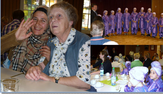
Treffen mit Muslimen