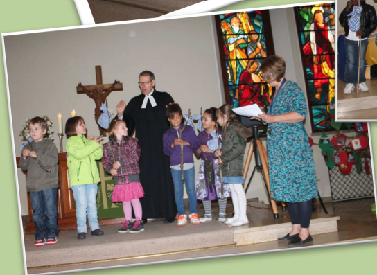
Kindergartengottesdienst am 28. Juni 2013 zum Abschied der Schulanfänger