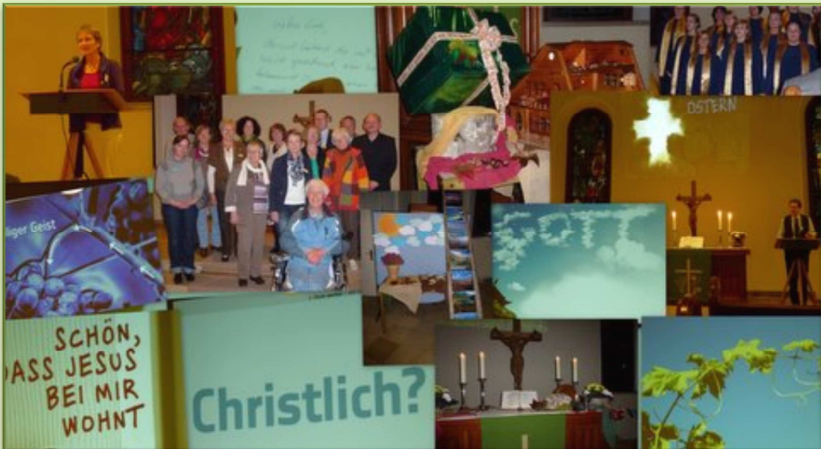
Bilder vom Glaubenskurs Spur8 im Herbst 2011

Ende April verbrachten die Chormitglieder einen ganzen Samstag im Skulpturenpark Kramelheide, genossen bei herrlichem Sonnenschein Kunst und Natur und probten vor allem ausgiebig Stücke, die demnächst bei Gottesdiensten und Konzerten gesungen werden.