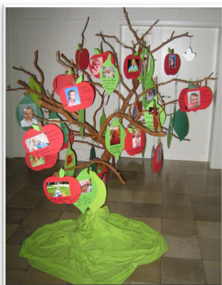
Taufbaum in der Kreuzkirche