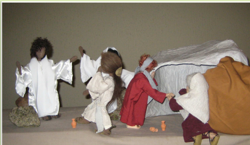
Andacht in der Kreuzkirche

Das Grab ist leer. Jesus ist auferstanden!