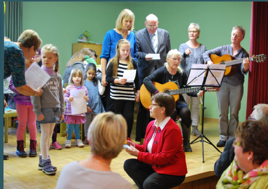
... mit Kindern und Mitarbeitern des Kindergartens