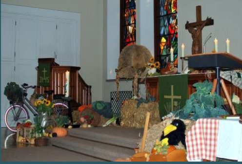
Erntedankfest 2016