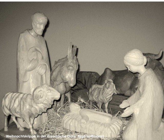
Weihnachtskrippe in der Kreuzkirche